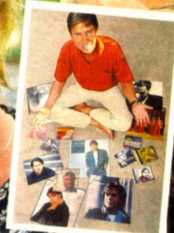
► Oase Hier kann der Sänger entspannen und Ideen für neue Songs finden